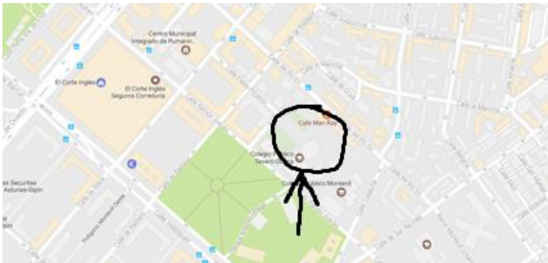
Ilustración 1: Ubicación donde se llevará a cabo el proyecto.

El II Campus de Patinaje de Velocidad Astur-Patín se ubica en las instalaciones del CP Severo Ochoa, sito en C/ del Rio Eo, 46, 33210 (Gijón, Asturias).