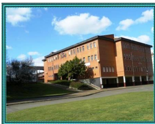
Ilustración 3: Zona inferior de las instalaciones