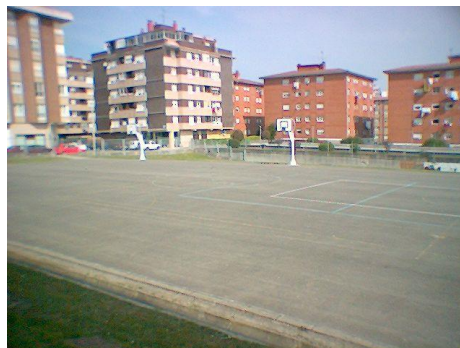
Ilustración 2: Pista polideportiva cubierta y descubierta